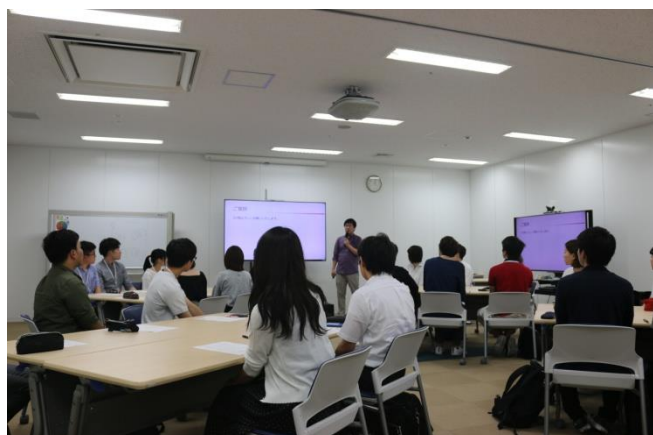
ヤフーニュース編集部によるワークショップ

ヤフー株式会社北九州センターは、国内でも第2番目の規模を誇るヤフー拠点です。北九州の若者に対する認知度向上と情報技術を通じた地域貢献がしたいというヤフー側の想い、学生たちのキャリアアップや地域への関心度を高めたい、という北九州市立大学及びCOC+事業側の想い、その両方の目的が上昇効果を生み出した3日間でした。特に、ヤフー北九州センターで活躍している北九州市立大学出身の社員が学生のチューターとして各学生のチーム（6人ずつの4つのチーム）に参加してくださったこと。学生自ら北九州地域の課題を探索して、それに対する解決策を探るといって課題解決型のワークショップであったこと。この2つの面は学生からも非常に良い評価をいただきました。ワークショップで導出された課題と解決策は、北九州市役所・ヤフー・地域戦略研究所の関係者の前でプレゼンテーションされて、有意義な議論が行なわれました。本内容は、ヤフー株式会社北九州センターの公式SNSにも公開されています。今後も北九州市立大学とヤフー株式会社北九州センターは、持続的に協力しながら学生の成長と地域の発展に力を尽くしていく予定です。