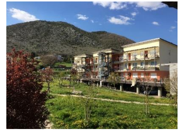
ラクイラの仮設住宅

科学研究費基盤(B)「災害や地域の特性に対応した木造応急仮設住宅の供給手法に関する研究」の一環で、2009年に発生したラクイラ大地震、及び2016年に発生したアマトリーチェ大地震の被災地を2018年4月17日から5日間の日程で訪問しました。ローマでは中央政府の機関である市民安全省で、大規模災害時の国レベルでの指揮命令系統などについてヒアリングを行うとともに、平常時の警察、消防、軍、沿岸警備隊、赤十字等の職員による組織横断的な監視体制を目の当たりにしました。イタリアでは倒壊した建物も、部材を集めなおし、ほぼ元通りに修繕するのが基本であるため、地震から10年近くたったラクイラ市も依然として復興半ばという状況でした。住宅の復興には相当な期間をかけて取り組まざるを得ないため、仮設住宅は10年以上住むことを前提としており、家具や家電製品はすべて揃い、収納も多く確保されるなど、日本のグレードとは全く異なっていました。防災・減災に向けた行政の姿勢、住民に寄り添った支援体制など、イタリア流の取り組みは今後の応急仮設住宅のあり方を考えるうえで大いに参考になりました。