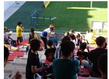
調査の様子(写真中央が調査員)

2018年は6月16日(土)にミクニワールドスタジアム北九州(北九州市小倉北区)で開催された2018明治安田生命J3リーグ第14節 ギラヴァンツ北九州 vs YSCC横浜において調査を実施し、426サンプルの有効回収を得ました。調査にご協力いただいた皆様に感謝申し上げます。