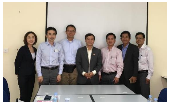
カンボジアの労働省でのヒアリング調査

北九州市の姉妹都市であるカンボジア・プノンペン及びベトナム・ハイフォンは経済成長が著しく、「建設ラッシュ」という言葉がまさにピッタリの街です。そこで9月下旬から、北九州地域の企業と両市を訪問して市場調査を行ってきました。その結果、日本製の建設機械は中古品であったとしても、中国製などの新品の建設機械よりも性能が良く、故障しないことから大変人気があることが分かりました。一方、中古品の輸出にあたっては、規制や支払条件などクリアしなければならない課題があることも分かりました。多くの北九州地域の企業が、海外に新たな市場を開拓できるように、姉妹都市による都市間連携の枠組みを活用して、今後ともサポートしていきたいと思えます。