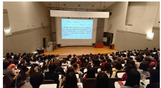
「地域の文化と歴史」第1回授業風景（10月7日）