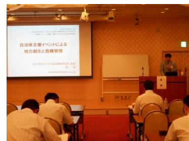
日本防火・危機管理促進協会 (会場: 大阪市) での講演 [南]