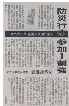
西日本新聞 8/29 付記事 での研究成果掲載 [南]