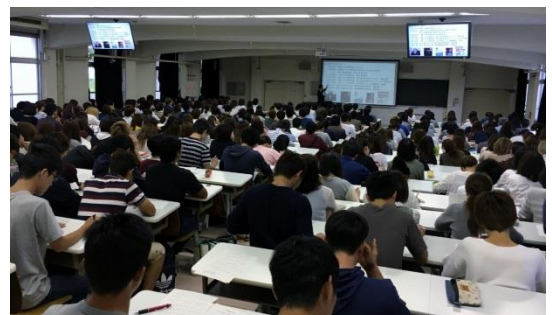
「地域の社会と経済」第1回授業風景（10月7日）