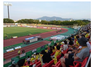
ギラヴァンツ北九州の試合でのスタジアム観戦者調査(受託研究)[南]