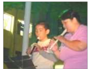
親子でリコーダー演奏。息もぴったり

この夜のお月様は、今か今かと立って待つうちに月が出るという「立待月」で、最後の最後に顔を見せて、主役らしくトリを飾ってくれました。