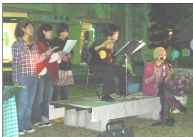
九州フィールドワーク研究会のみなさんによる演奏と合唱。参加者も一緒にうたう~