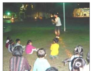
大道芸愛好会の学生さんの数々の技に子ども達が釘づけ。「すご~い!」