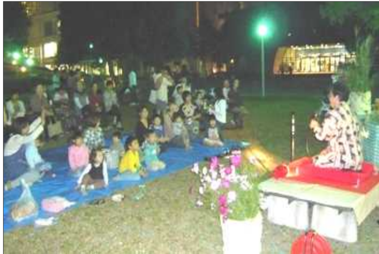
コラボラ亭・小茄子ちゃんの小囃からはじまった観月会

観月会(お月見会) 十月十七日(金) 十八時~二十時 北九州市立大学にて 主催 高齢社会をよくする北九州女性の会 共催 コラボラキャンパスネットワーク