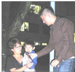
サークル「TIE-葉」の学生さんによるネイチャーゲーム。五感を澄まして挑戦!

観月会(お月見会) 十月十七日(金) 十八時~二十時 北九州市立大学にて 主催 高齢社会をよくする北九州女性の会 共催 コラボラキャンパスネットワーク