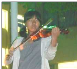
バイオリンの音色にうっとり~

お天気にも恵まれた観月会。3回目になる今年は100名を超える参加がありました。小囃・コント・サークルの学生による大道芸などパフォーマンスも年々充実してきて参加者全員で盛り上がりました。また、小学生の女の子によるバイオリン演奏やフルート演奏などもあり、月明かりの幻想的な雰囲気の中で音楽を楽しみました。芝生広場にはスタードームにあかりが灯り、親子がまったりとくつろいでいました。