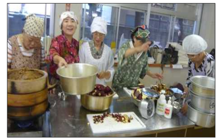
「高齢社会をよくする北九州女性の会」のグランマさん達が、心を込めて作ってくれたお月見団子100セットが、あっという間に完売! 大好評!