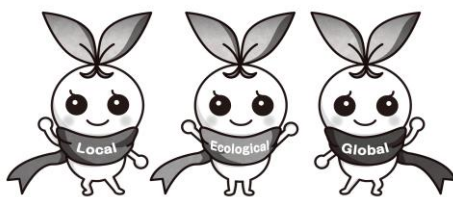
北九州市立大学 公式マスコットキャラクター きたきゅっち

公立大学法人 北九州市立大学 事務局総務課人事係 職員採用試験担当 〒802-8577 北九州市小倉南区北方四丁目2番1号 TEL : 093-964-4107 FAX : 093-964-4000